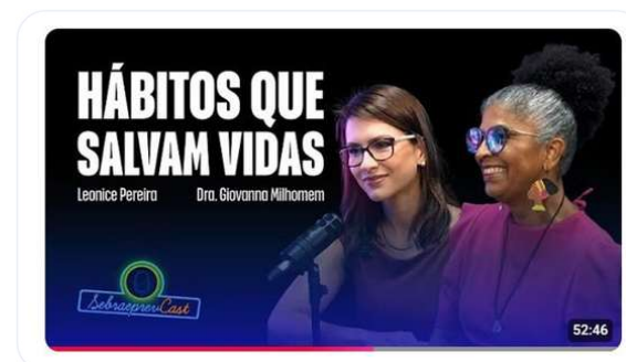
Podcast SebraePrevCast #76